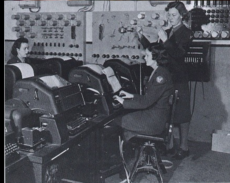
WACs assigned to the Eighth Air Force in England operate teletype machines.